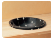
埋め (開口サイズ S: φ 340mm / SS: φ 300mm)