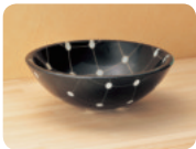
置き (開口サイズ: 約 60mm)