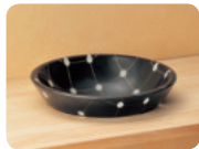
半埋め (開口サイズ S: φ 280mm / SS: φ 240mm)