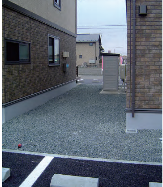
アパート廻りでの施工例