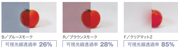
B/ブルースモーク R/ブラウンスモーク F/クリアマット2 可視光線透過率 26% 可視光線透過率 28% 可視光線透過率 85%