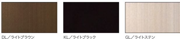
DL/ライトブラウン KL/ライトブラック GL/ライトステン