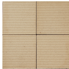
クリームイエロー