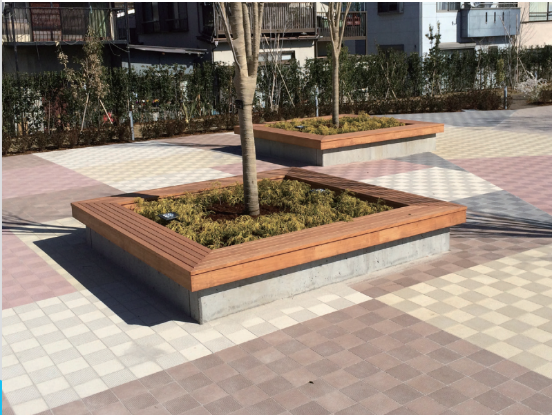
ミルクホワイト、アッシュグレー、クリームイエロー、ローズピンク、ヘーゼルブラウン(226E)