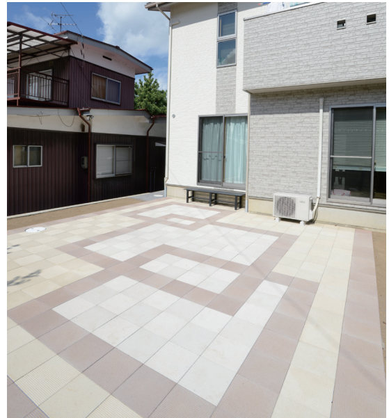
ミルクホワイト、クリームイエロー、ヘーゼルブラウン(3366E)