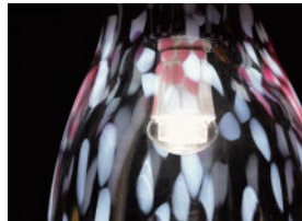
りんごの実や花の可愛らしいイメージ