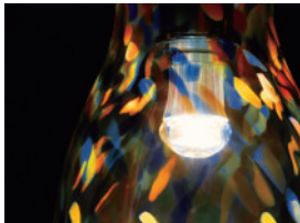
ねぶた祭りの鮮やかな色彩や熱気イメージ

憧れの空間ガーデンルームに、個性に合わせたペンダントライトをコーディネートすれば、夜はお酒を飲みながら夫婦の時間を過ごしたり、家族団らんを楽しんだり癒しの空間になります。