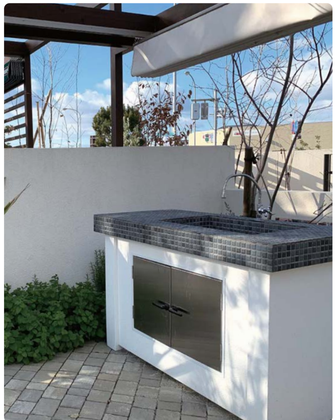
シンク天板 オールタイル1300右 1300用前パネルステンレス扉 側面ボード×2、1300用後パネル