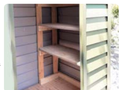
2×4材で 棚を設置 した例

耐久性に優れた高品質パネルを採用。また英国基準の防火性能承認を受けています。メンテナンスフリー。