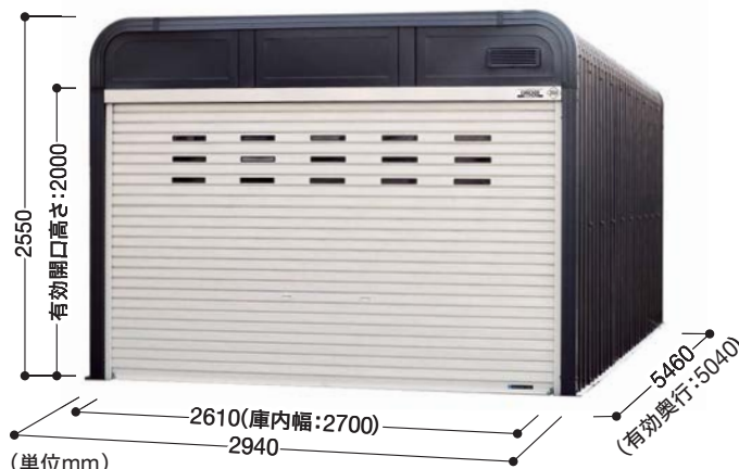
■掲載例 カラー/本体:ディープグリーン シャッター:ブラウン