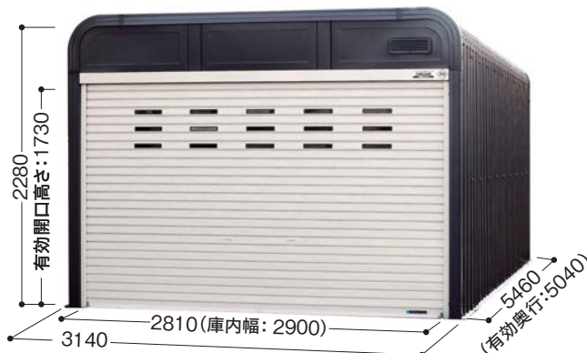
掲載例 カラー/本体:ブラックグレー シャッター:ホワイト オプション 増設1スパン、リモコンシャッター※記載の寸法は増設を含まない標準寸法となります。(単位mm)