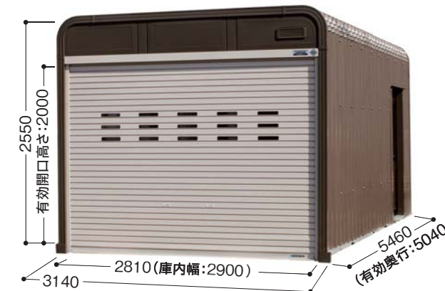
掲載例 カラー/本体:ブラウン シャッター:ブラウン オプション 引戸C(ブラウン)、リモコンシャッター(単位mm)