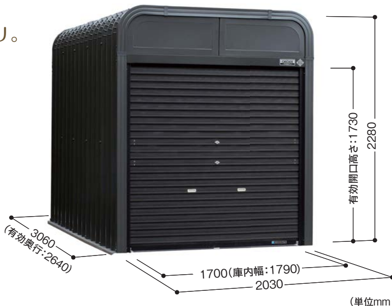
■掲載例 カラー/本体:ブラックグレー シャッター:ブラック

バイクガレージとしてだけでなく、 物置としての使用もおすすめ。 内高が高いので収納力もバッチリ。