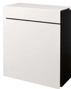
しゅい ■ 漆喰ホワイト色 CTZR2600WS