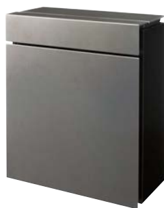
■ ステンシルバー色 CTZR2600SC