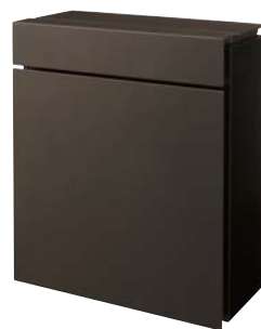
■ エイジングブラウン色 CTZR2600MA

※玉吹き塗装ですので、一品一品色合いが異なります。(並べてご使用の場合はご注意ください。)