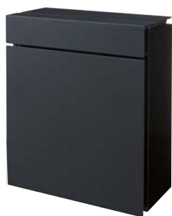
ちゅうてつ ■ 鑄鉄ブラック色 CTZR2600TBK