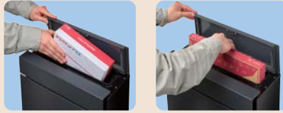
ゆうパケットプラス専用箱 (幅240×奥行170×高さ70mm) ゆうパケットプラス専用箱 (幅327×奥行228×高さ30mm)